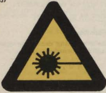
Warnung vor Laserstrahl